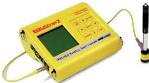
دستگاه سختی سنج پرتابل Proceq Equotip ۲ - ساخت سوئیس

سختی سنج پرتابل جهت اندازه گیری سختی لیب فولاد، فولاد ریخته گری شده و چدن بکار می رود. دستگاه سختی سنج پرتابل بر اساس اندازه گیری سرعت برخورد و بازگشت فرورونده کروی از جنس کاربید تنگستن عمل می کند.