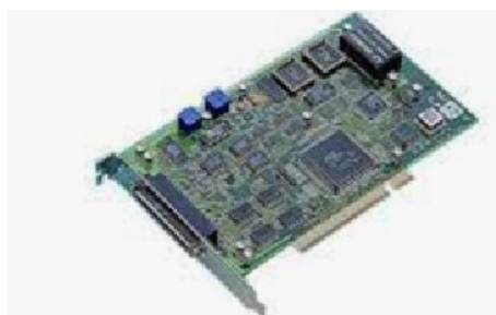
PCI-1711 - 100 kS/s, 12-bit, 1.